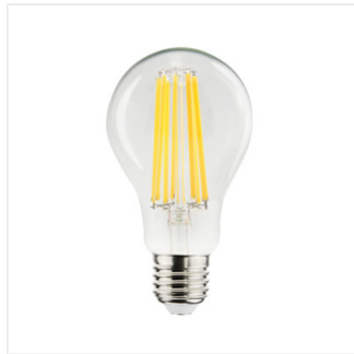
XLED A70 15W-NW