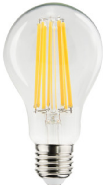
XLED A70 15W-WW